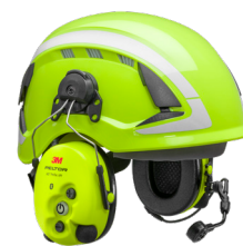
MT15H7P3EWS6 / MT15H7P3EWS6-111