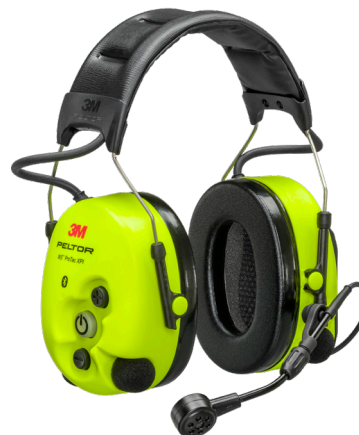
MT15H7AWS6 / MT15H7AWS6-111