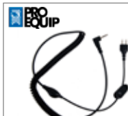
Adaptateur pour casque Peltor (prise nexus)