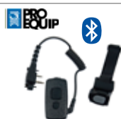
Boîtier PTT sans fil Bluetooth avec entrée jack 2,5 mm