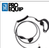
Microphone cravate avec oreillette contour d'oreille