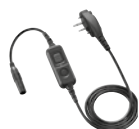
Boîtier PTT avec entrée jack 2,5 mm