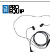
Ecouteurs avec microphone