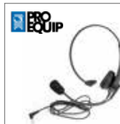
Casque contour de tête avec micro flexible