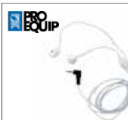
Ecouteurs avec microphone type iPhone