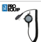
Boîtier PTT avec entrée jack 2,5 mm